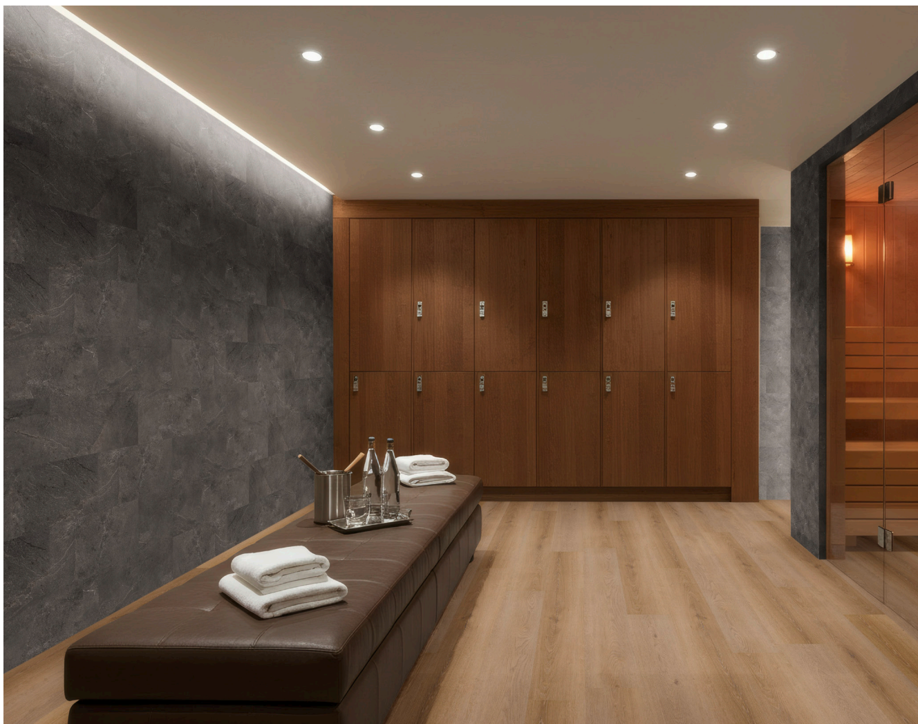
Sämtliche Abbildungen können farblich vom Originalprodukt abweichen.