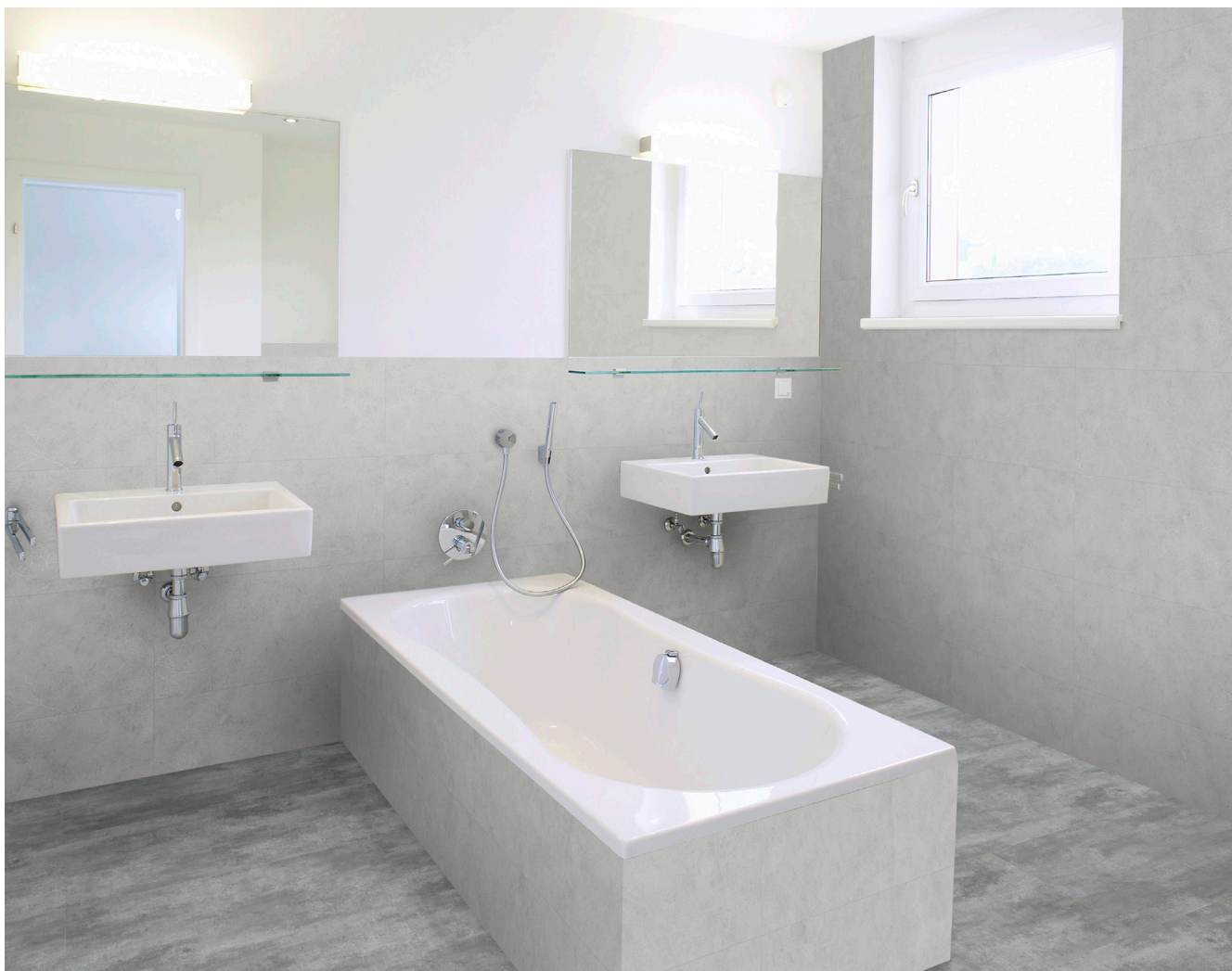
Sämtliche Abbildungen können farblich vom Originalprodukt abweichen.