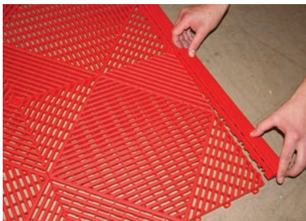
Seiten- und Eckteile anbringen