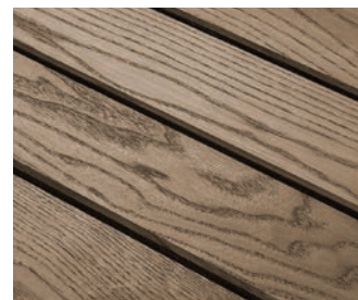
Natürlicher Farbton behandelter Klickfliesen

Nun kann das Öl gleichmäßig aufgetragen werden. Hier eignet sich ein handelsübliches Pflegeöl für Holz. Wir empfehlen jedoch ein Öl mit hohem UV-Schutz zu verwenden. Durch das Öl werden die Poren verschlossen und Verschmutzungen können sich nicht mehr so einfach festsetzen. Das erleichtert die Reinigung im Nachhinein.