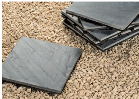
Verlegung ohne Kleber oder Fugenmörtel