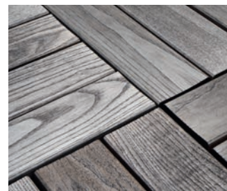
Natürlicher Farbton nach einigen Monaten ohne Behandlung