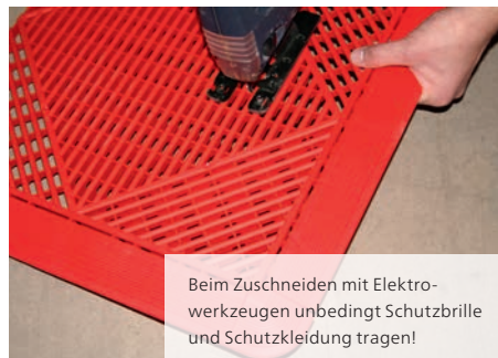
Falls nötig zuschneiden