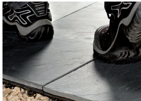
Sofort begeh- und belastbar