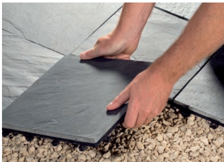
Schnell & einfach auf- und abbauen